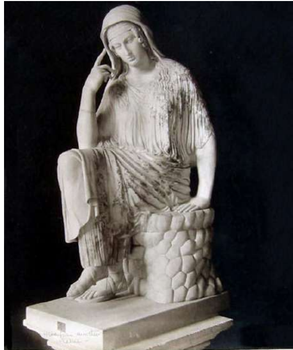
Fotografia di Carlo Brogi, 1900 ca - Penelope , Museo Pio Clementino, Vaticano-Roma, I sec. d.C.

I Proci sono la meglio gioventù, ricca e tracotante, delle isole Ionie «noi abbiamo ucciso il baluardo della città, i più nobili fra i giovani d'Itaca» (Omero, 2021, p. 354). Legittimamente pretenderebbero di occupare il posto lasciato vacante dal re. Penelope tiene loro testa per tutto il tempo in cui lo sposo è