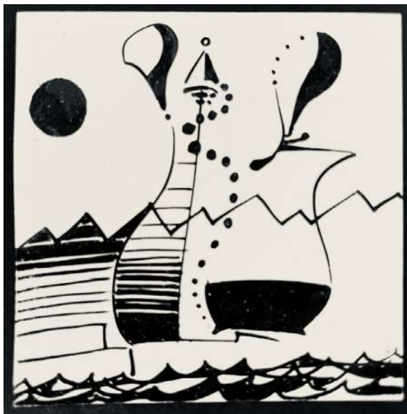
Dende, Onde di ebbrezza , 2023, per gentile concessione dell'Autore

La notte con Odisseo rappresenta una coniunctio , una nuova fecondazione tramite cui l'elemento maschile, non più Bios ma Animus , interiorizzato, scioglie il vincolo e libera.