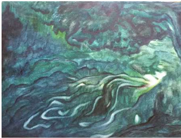
Grossi C., Verde Malachite , 1989

Ne Il telaio incantato della creazione , Frigoli descrive così il punto di approdo: «Eccoci proiettati nell'esperienza del Sé! L'esperienza del Sé dona un senso di libertà, di espansione, di comunicazione con gli altri Sé e con la realtà, conferendoci il senso della nostra universalità» (Frigoli, 2022, p. 136). Nello stesso testo viene anche suggerita una via per la meta: «Nell'opera Tripura Rahasya [...] è descritto che un discepolo, per realizzare la condizione di "liberazione in vita", si era affidato ad un maestro per "bruciare" nel rapporto con lui, ogni vincolo di dipendenza. Quando giunse al termine del suo percorso di conoscenza in lui dominava uno spirito impassibile [...]. È sveglio dormendo e dorme restando sveglio» (Frigoli, 2022, p. 226). È proprio la dinamica della dipendenza a sollecitare la curiosità di donna e di madre rispetto alla strada verso il Sé: l'amore materno è il contrario dell'impassibilità. Ineffabile e totale, è una perpetua tensione amorosa