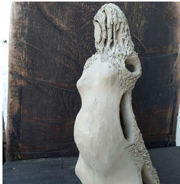
Grossi C., L'attesa , 1969, per gentile concessione dell'Autrice

Nella quiete della maturità, un respiro, fattosi ora più ampio, invita ad esplorare lo spazio che intercorre tra il Bios e la materia sottile del Sé. Il Vangelo di Giovanni chiama in causa queste due polarità nel «Καὶ ὁ λόγος σὰρξ ἐγένετο – et Verbum caro factum est – e il Verbo si fece carne» (Gv, 1,14). Il tramite per il quale il Verbo si incarna è un ventre, lo iato è colmato dal corpo di donna che ne è ponte. Generati, carne pulsante dal grembo materno, ci troviamo spinti da una umana tensione verso la luce, la conoscenza, la totalità: il Verbo si è fatto carne ma, umani, un anelito ci spinge di nuovo al Logos. Il Sé come mèta orientante, in quanto luminosa, compare nel Prologo del Vangelo di Giovanni, come origine: «In principio era il Verbo, [...] tutto è stato fatto per mezzo di lui, e senza di lui niente è stato fatto di tutto ciò che esiste. In lui era la vita e la vita era la luce degli uomini; la luce splende nelle tenebre, ma le tenebre non l'hanno accolta» (Gv, 1,1-5).