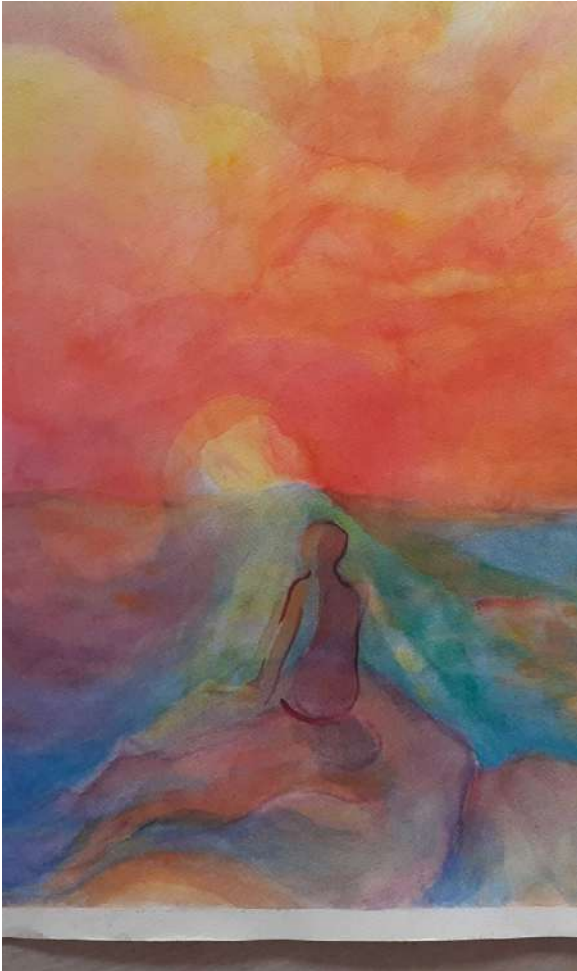
Frugis R, Approdo , 2018, per gentile concessione dell'Autrice

Ecco il tempo in cui la vita di donna, sempre scandita dal ritmo della marea, lenta si placa: giunge la menopausa a fermare gli ondosi moti che fin qui la governavano. La primavera sfiorisce, matura l'estate e la vita appare piana come un campo di spighe mature in un giorno di sole calmo, senza vento. Rallentando, si disvela un orizzonte insospettato.