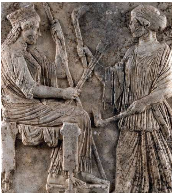
Bassorilievo in marmo raffigurante Demetra e Persefone, Eleusi, Grecia, V sec. a.C.

Più che nascere, Biancaneve pare sgorgare dal pensiero/desiderio della buona regina senza l'intervento di alcun elemento maschile fecondante. L'Uroboro non ha declinazione di genere, e la nascita implica, del femminile, l'elemento generativo materno. Come Demetra e Kore, confuse in una, la regina e Biancaneve sono coppia originaria, esclusiva e a sé bastante.