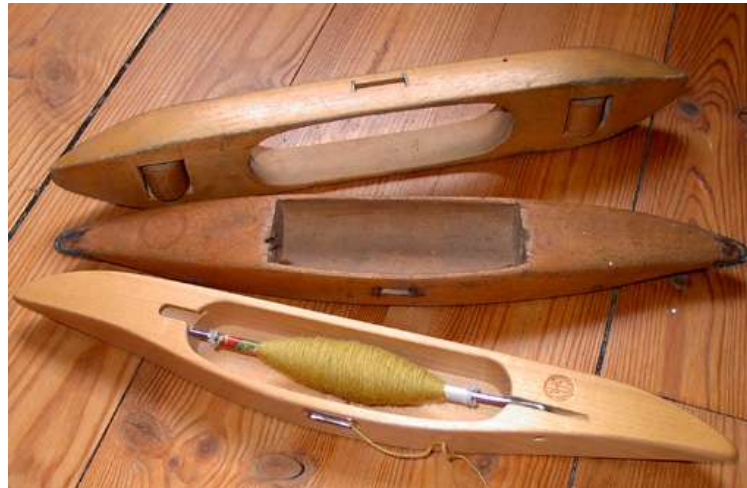
Navetta per la tessitura del legno.

adulta e regina, affronta del maschile le caratteristiche più turpi e primitive. Gli uomini che la pretendono sono infatti prepotenti e arroganti, e questa umanità svilta viene tenuta a bada con l'arguzia della tela.