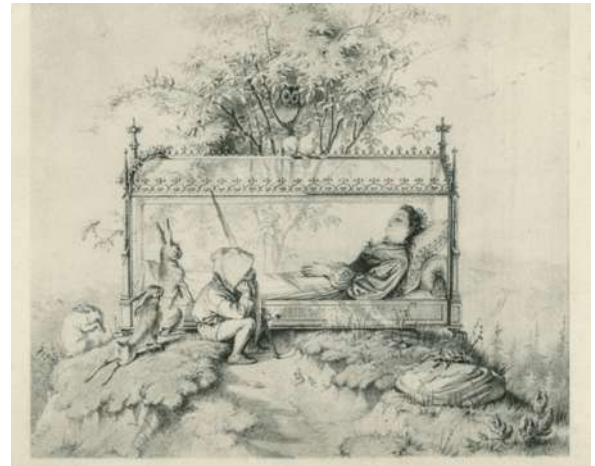
Albert Hendschel, illustrazione di Nano con Biancaneve vicino alla bara di vetro , 1871

Sedotta, Biancaneve appare perduta: i suoi alleati d'infanzia, per quanto sapienti, sono ora impotenti. Le preparano una bara, vitreo giaciglio, dove sempre qualcuno la veglia: a turno, loro protettori e amici, e tre animali che spiegano bene la qualità trasformativa del tempo dello strano oblio della fanciulla. E' un'incubazione e la civetta notturna, il corvo e la bianca colomba ripropongono il tema alchemico dell'incipit della fiaba: dal nero, attraverso il rosso, verso il bianco. «Dissero: - Non possiamo seppellirla dentro la terra nera- e fecero fare una bara di cristallo, perché la si potesse vedere da ogni lato, ve la deposero e vi misero sopra il suo nome, a lettere d'oro, e scrissero che era figlia di re. Poi esposero la bara sul monte, e uno di loro vi restò sempre a guardia. E anche gli animali vennero a pianger Biancaneve: prima una civetta, poi un corvo e infine una colombella». Biancaneve rimase molto, molto tempo nella bara, ma non impudridì: sembrava che dormisse, perché era bianca come la neve, rossa come il sangue e nera come l'ebano. Ma un bel giorno capitò nel bosco un principe» (Grimm, 1992, p. 190).