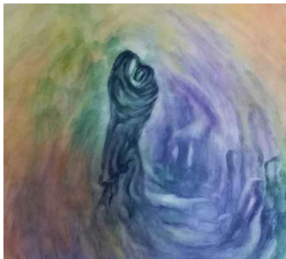
Grossi C., Maternità in idaco , 1990, per gentile concessione dell'Autrice

Ne Il telaio incantato della creazione , Frigoli descrive così il punto di approdo: «Eccoci proiettati nell'esperienza del Sé! L'esperienza del Sé dona un senso di libertà, di espansione, di comunicazione con gli altri Sé e con la realtà, conferendoci il senso della nostra universalità» (Frigoli, 2022, p. 136). Nello stesso testo viene anche suggerita una via per la meta: «Nell'opera Tripura Rahasya [...] è descritto che un discepolo, per realizzare la condizione di "liberazione in vita", si era affidato ad un maestro per "bruciare" nel rapporto con lui, ogni vincolo di dipendenza. Quando giunse al termine del suo percorso di conoscenza in lui dominava uno spirito impassibile [...]. È sveglio dormendo e dorme restando sveglio» (Frigoli, 2022, p. 226). È proprio la dinamica della dipendenza a sollecitare la curiosità di donna e di madre rispetto alla strada verso il Sé: l'amore materno è il contrario dell'impassibilità. Ineffabile e totale, è una perpetua tensione amorosa